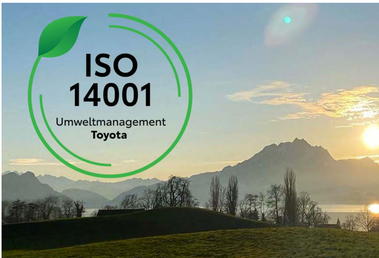
Die Umweltmanagementnorm ISO 14001 ist weltweit anerkannt.