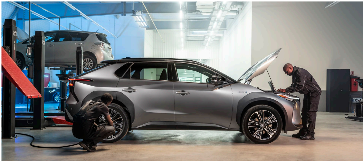
Sicher unterwegs und 10 Jahre Garantie: Der vollelektrische Toyota bZ4X